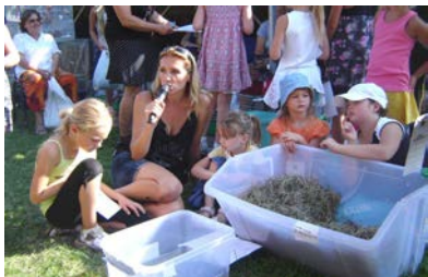
Foto z přednášky na chovatelském dni 2011

Členka Výboru ZO ČSCH Újezd nad Lesy 21. 2. 2012