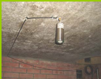
Čidlo u stropu OK2 (PD-10.8.11)

Faktem ovšem je, že nová kanalizace neprosakuje a nedochází tak k trvalé kontaminaci spodních vod a půdy o „106“ po celé její délce. Nyní se totiž splašky dostanou do lesa alespoň jen silně zředěné s dešťovou vodou. Ovšem zapáchá to někdy taky pěkně.