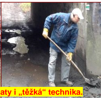
K úpravě byly použity lopaty i „těžká“ technika.

Další informace najdete na: www.svobodnyujezd.cz