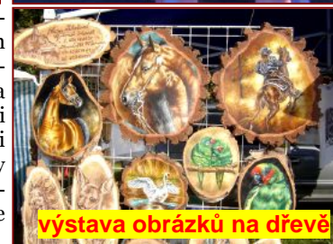
výstava obrázků na dřevě

Letos se však článek chovatelů do ÚZ dostal. Konkrétně do 11/13 na stranu 5. Sice z počátku šéfredaktorka Černá požadovala opět zkrácení, nebo rozdělení článku s tím, že část by otiskla a část dala na web úřadu, ale nakonec otiskla článek celý. Prokázala tím více rozumu a příznejme si i více chyt-