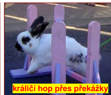
králičí hop přes překážky

Chovatelé si totiž dokázali vyjednat záštitu magistrátu nad jejich dnem i s finanční podporou. Jakoliv to shazovat bylo ubohé a přízemní. Doslova trapné bylo i to, že okolní obce a městské části (i vzdálené, třeba Dubeč) otiskly článek chovatelům celý, bez problémů i s fotografiemi, přestože se chovatelský den u nich nekonal.