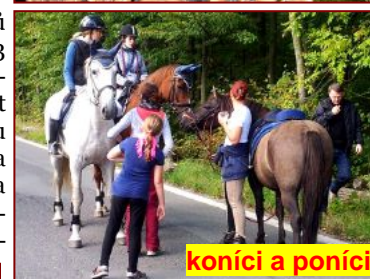
koníci a poníci