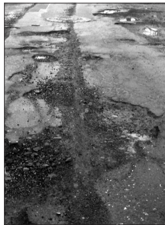
Silnice nebo tankodrom?