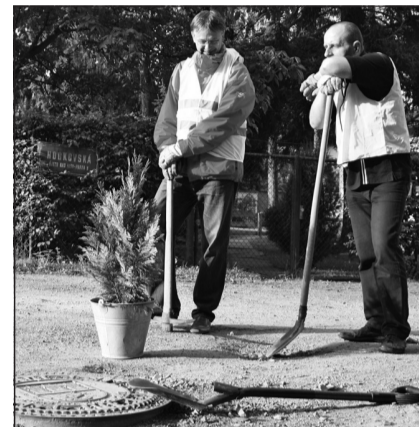
Zelené řešení tankodromu v Hodkovské ulici. Kolem kanálů vysázejí stromky