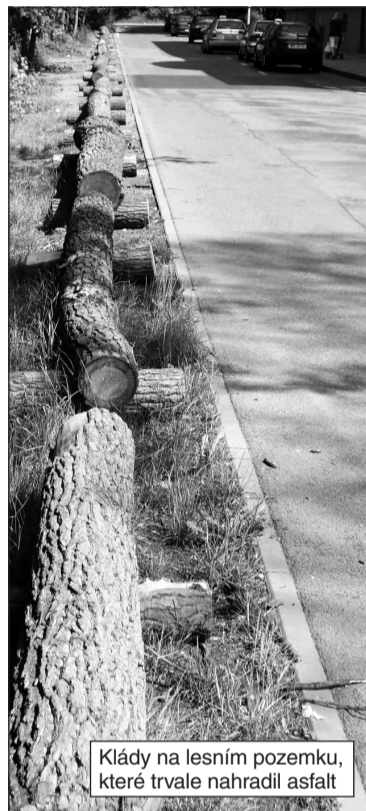
Klády na lesním pozemku, které trvale nahradil asfalt

Problematická bezpečnost cyklostezky. Cyklisté se míjí v těsné blízkosti s protijedoucími auty, která musí jezdit těsně podél dvojitě čáry vlevo, neboť vpravo jsou kontejnery a parkoviště.