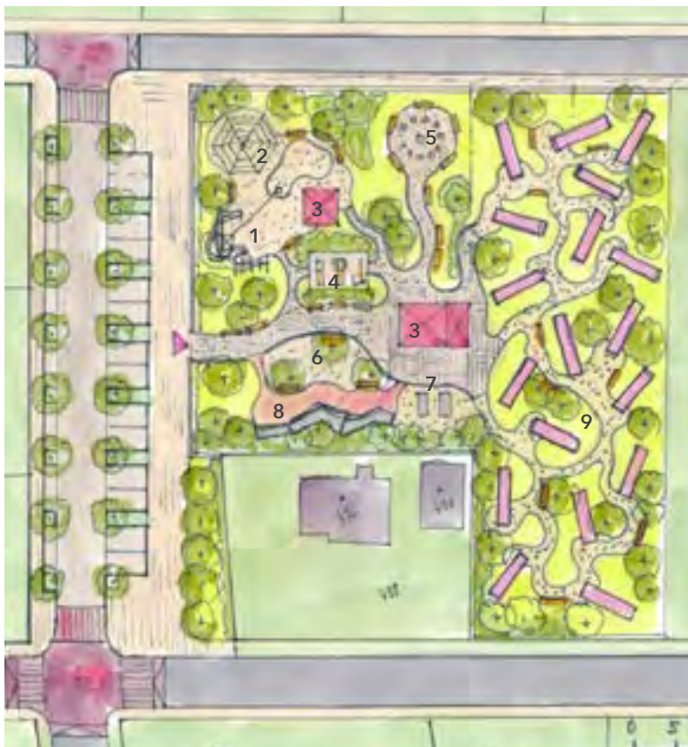
ÚJEZD NAD LESY - AKTIVITY V PARKU - VAR 1

Dobrá otázka. Je mi jasné, kam míříš, protože ses na realizaci jednoho hřiště, pokud vím na Blatově, podílel. Bude nutné zvolit samozřejmě takové hrací prvky, které bude možné přenést následně jinam. Jednoho dne budeme muset pozemek samozřejmě opustit a uvolnit pro nějaký pěkný rodinný dům.