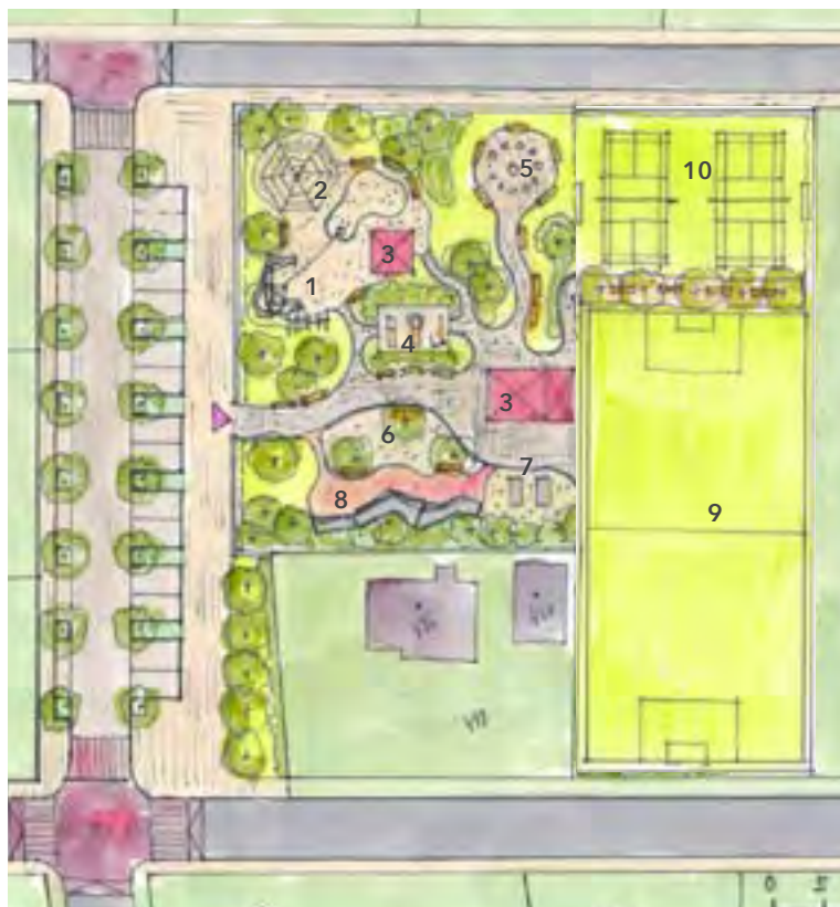
ÚJEZD NAD LESY 2020